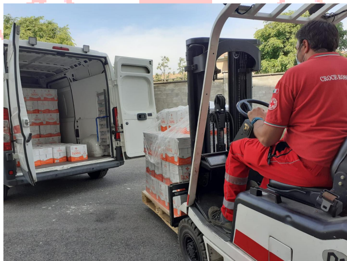
Raccolta di viveri da distribuire alla popolazione