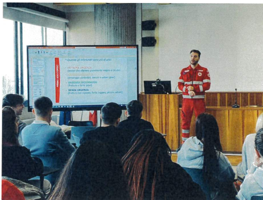
Attività di informazione propaganda "Educhiamo alla Salute e al Benessere" presso le Scuole Secondarie di 2 Grado di Treviglio