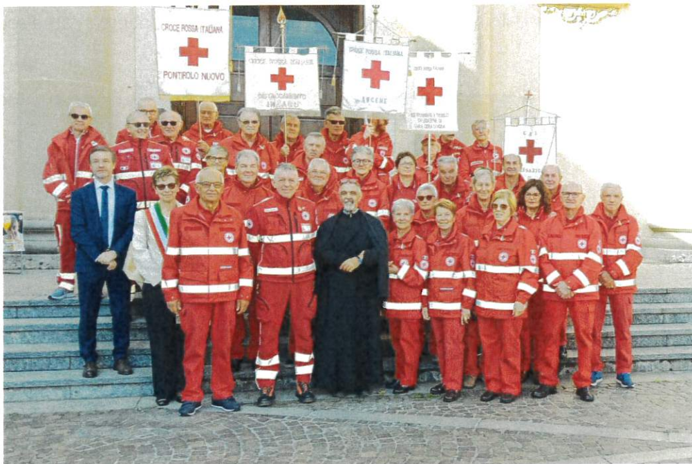
22.10.2023 30° anniversario Unità Locale di Pontirolo Nuovo