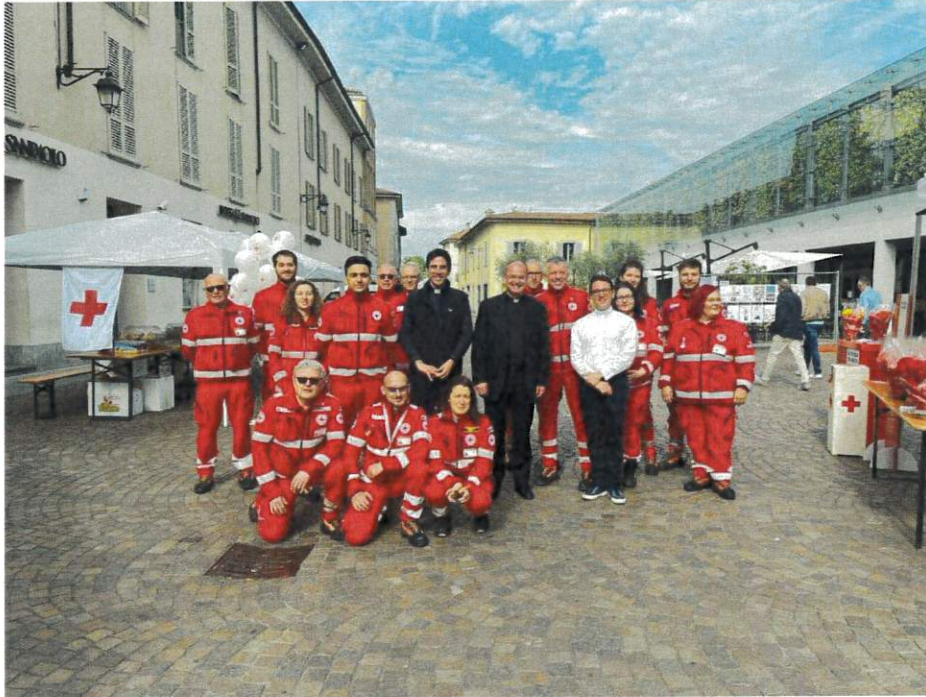
Festa Mondiale della Croce Rossa maggio 2023