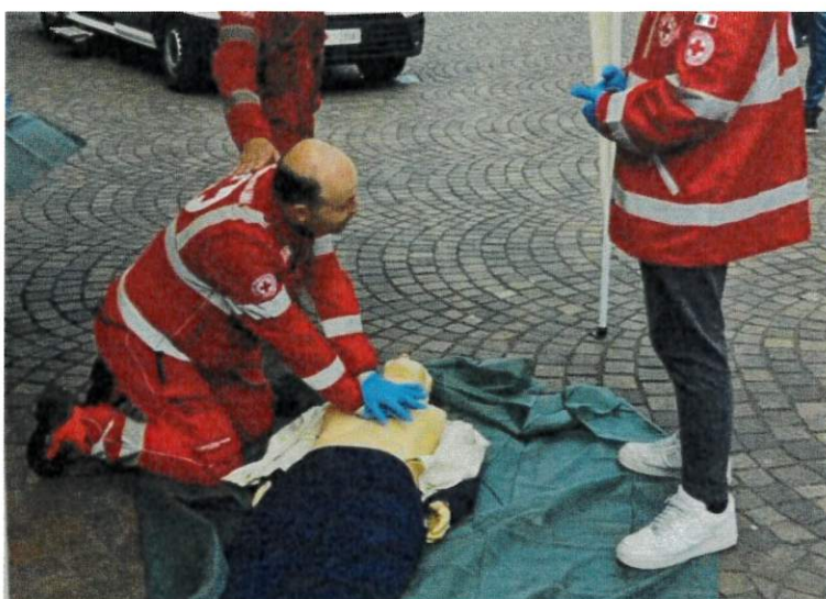
Dimostrazione di RCP in Treviglio Piazza Garibaldi in occasione della Giornata Mondiale della Croce Rossa Italiana.