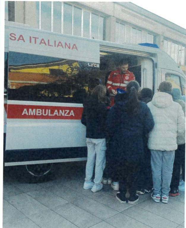
Attività di informazione propaganda "Educhiamo alla Salute a al Benessere" presso le Scuole Secondarie di 1 Grado di Lurano