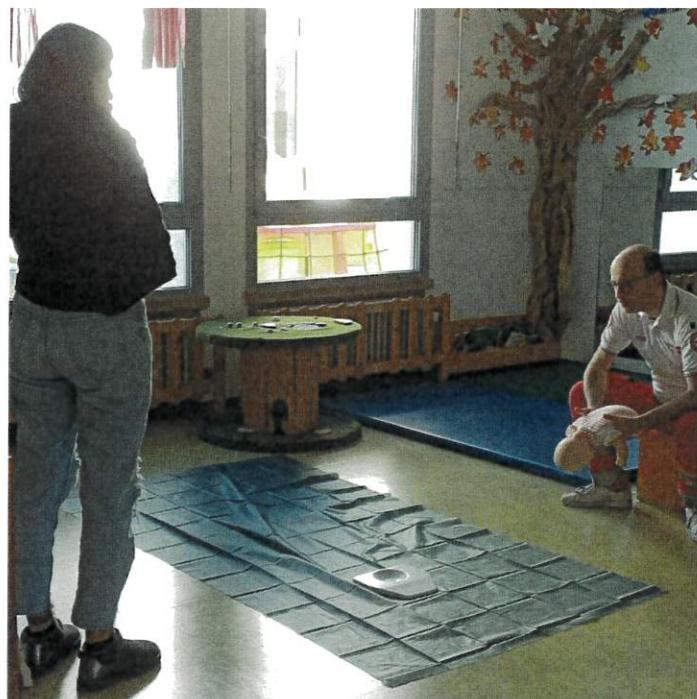
Corso di Manovre Salvavita Pediatriche presso Asilo Nido di Inzago